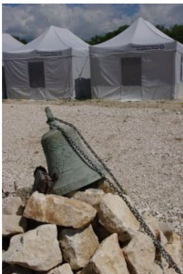
Onna, giugno 2009