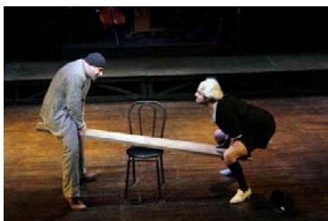
una scena dello spettacolo "Terra matta" di Vincenzo Pirrotta

Che Vincenzo Rabito sia uno degli indiscussi protagonisti della storia dell'Archivio dei diari e' ormai un fatto consolidato. Avete provato a digitare i termini "Vincenzo Rabito" su Google o su YouTube? Su Facebook c'e' una pagina di fan a lui dedicata e adesso e' consacrato come scrittore anche da Wikipedia . Mario Perrotta nel suo libro Il paese dei diari gli dedica uno spazio di prim'ordine, proposto al pubblico di Pieve per il recente evento Sedici gradini .