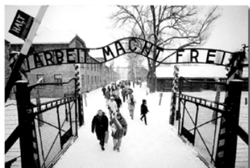
Auschwitz, 2005