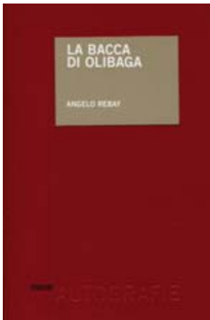
la copertina numero uno della collana Autografie