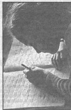
I ragazzini e la scrittura: un rapporto intenso che trova spazio in diari, lettere e piccole memorie